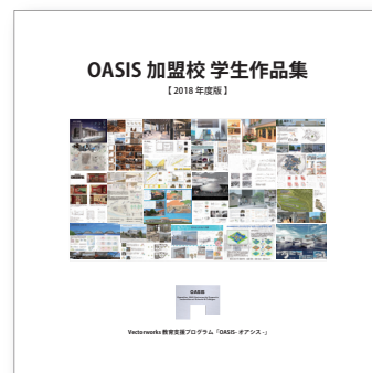
※画像は、学生作品集のイメージです