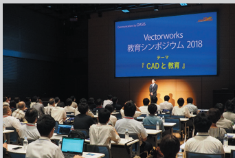
Vectorworks 教育シンポジウム 2018の様子